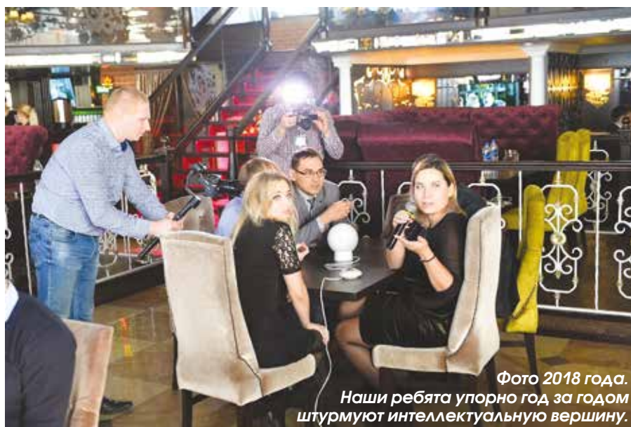
Фото 2018 года. Наши ребята упорно год за годом штурмуют интеллектуальную вершину.

Команда уникалов и умниц «ТМС групп» стала победителем онлайн-квиза ПАО «Татнефть»